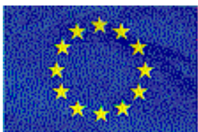
Unione Europea Fondo Sociale Europeo